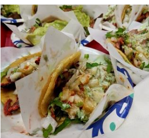
Tacos de adobada