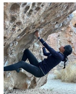
ビショップ・ボルダーズ

カリフォルニアの自然環境は国立公園が9つあり、国有林が18もあります。ヨセミテやジョシュアツリー、ビショップのバターミルクなど、世界中のロッククライマーたちの中で人気な場所もあります。