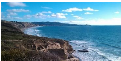
Torrey Pines State Natural Reserve