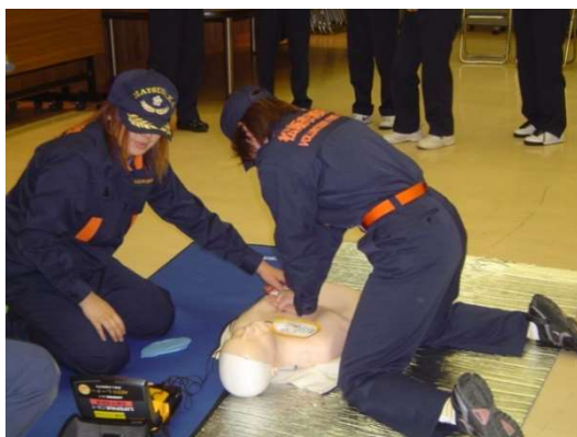
応急手当指導の様子

また、火災予防思想や、応急手当に関する正しい知識と技術を地域みなさんにわかりやすく、幅広く普及させるため、女性消防団員らが人形劇等を用いた防火・救急啓発活動を展開しています。