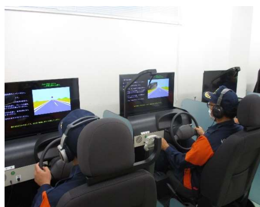
運転適性検査（ART）の様子