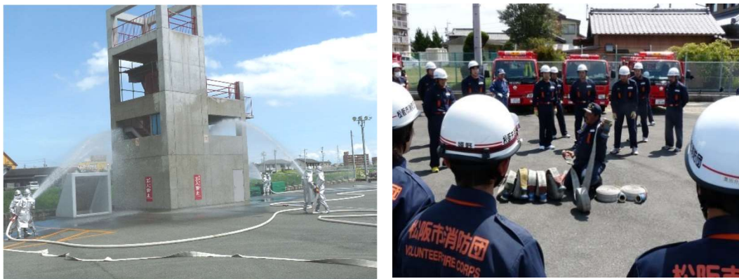
消防訓練塔を活用した消火訓練の様子

その中で平成21年2月に「消防訓練塔」を松阪市消防・防災訓練センターに建設し、火災対応等の実戦訓練を定期的実施しています。