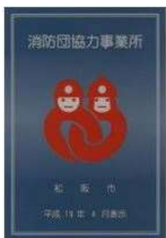
松阪市消防団協力事業所表示証