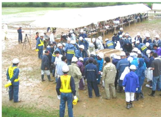
訓練での安全管理員の様子

消防団活動の安全管理の徹底を図るため、災害現場で団員の活動を監視し、危険行動等の危険要因を排除する安全管理員（副分団長）と、現場指揮本部と現場活動中の分団長の無線連絡を専門に行う伝令員（部長又は班長）を各分団で任命し、災害現場等での事故防止に努めています。また、安全管理員と伝令員には、それぞれ反射ベストと腕章の装着を義務付けています。