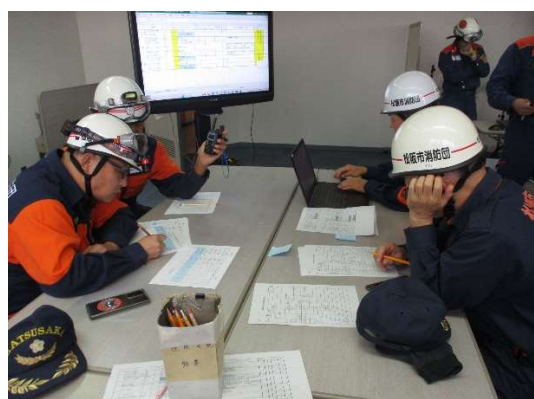
松阪市総合防災訓練における無線機活用の様子