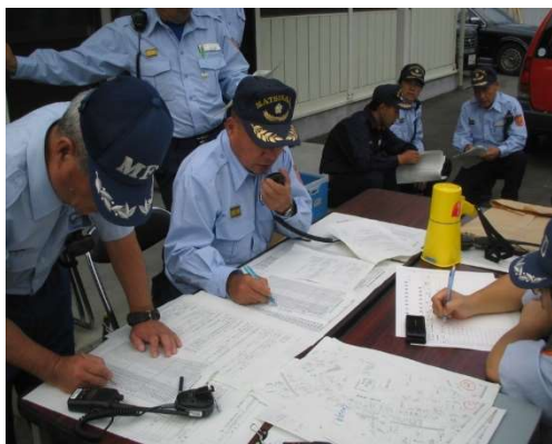
無線機取扱訓練の様子

災害発生時に消防団が効果的な活動を行うためには、指揮統制や情報の共有等が必要不可欠であることから、令和元年度から消防団波の携帯IP無線機を各分団長に計画的に配備し、現在、68機の携帯IP無線機を活用しながら、消防団活動を実施しています。また、災害現場等では複数メンバーが効率よく情報を共有するため、トランシーバーでの交信を原則としています。