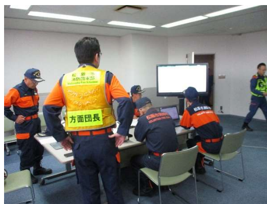
松阪市総合防災訓練の様子