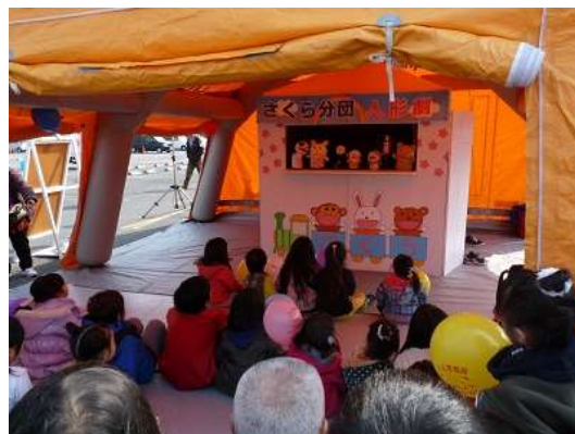
イベントでの人形劇の様子