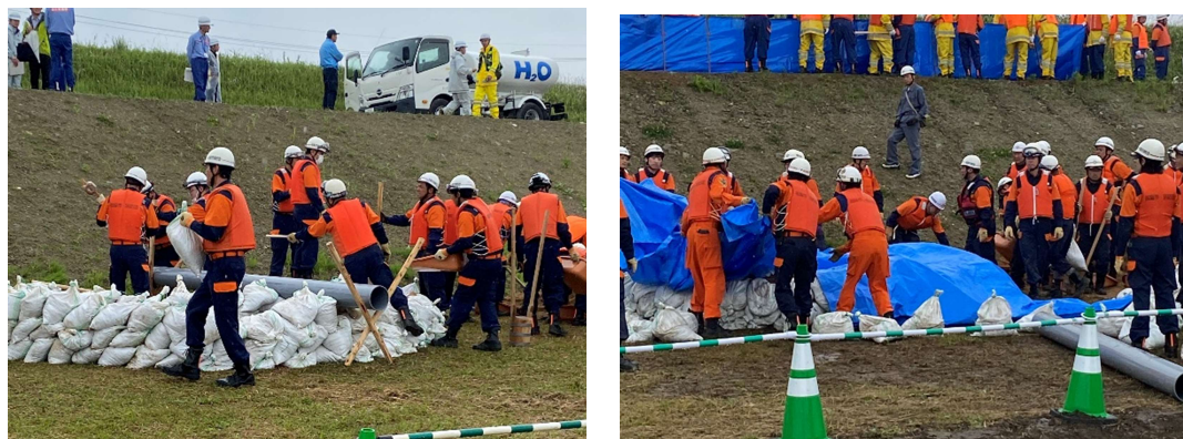
総合水防演習の様子

近年増加する豪雨などの大規模水害に備えるため、水防体制の確立をめざし、三重四川連合総合水防演習に参加しました。参加機関が救命胴衣を装着して参加する実働訓練により、近隣市町や関係機関との連携強化を図るとともに、参加者全員の水防意識の向上をめざしています。