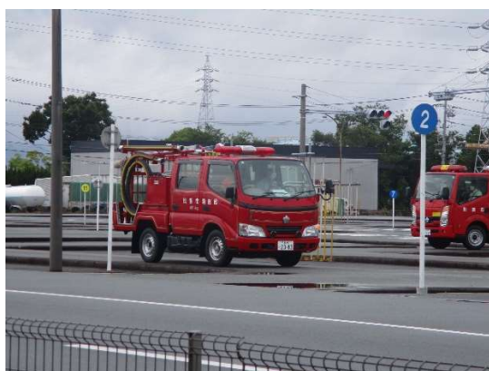
運転技術診断の様子

平成 19 年度から自動車学校にて運転適性検査（ART）、消防車両を使用した運転技術診断、同乗者安全確認診断等の安全運転研修を行い、交通マナーやルールを再認識することで、緊急走行時等における安全管理の徹底を図り、交通事故防止に努めています。