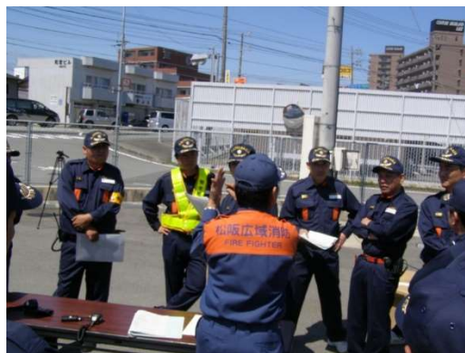
安全管理者研修の様子