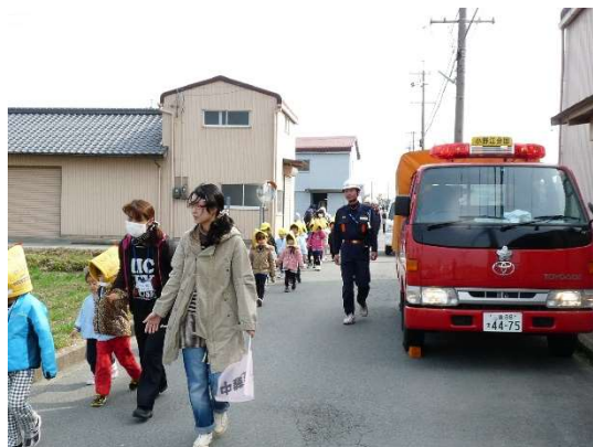
避難誘導訓練の様子