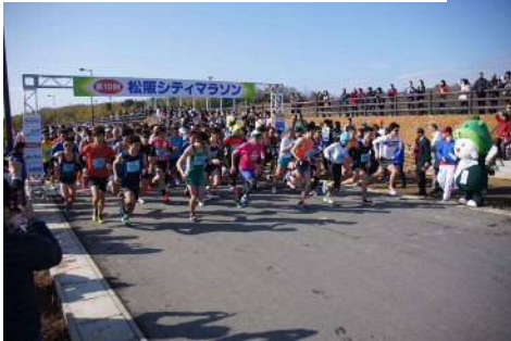
▼松阪シティマラソン

本市最大のスポーツイベントである松阪シティマラソンを充実し、市長杯の大会など、子どもから高齢者までの幅広い世代の市民がスポーツに興味・関心を持てる市民参加型の各種スポーツ大会を開催していきます。スポーツへの関心をより高め、また技術向上の一助として、トップアスリートによるスポーツ教室や交流会を実施します。