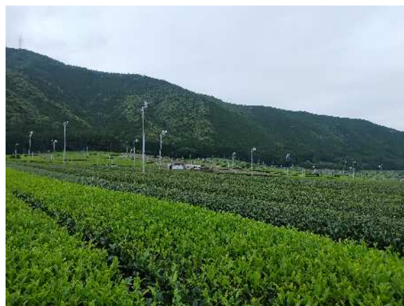
重点地区（候補）のエリアと緑が美しい柳瀬新田・大溝新田の茶畑