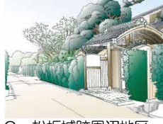
C 松坂城跡周辺地区