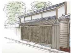
A 通り本町・魚町一丁目周辺地区