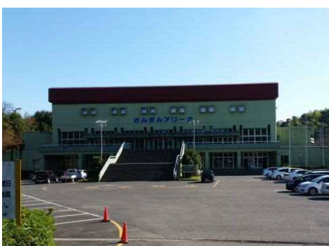
▼さんぎんアリーナ

既存のスポーツ施設等の利便性をより高め、市民がより快適にスポーツに取り組むことができる環境を整備します。また施設に関する市民ニーズの把握に努め、より多くの市民が安全で快適に利用できるスポーツ環境の整備に取り組みます。