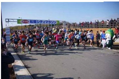
▼松阪シティマラソン

本市最大のスポーツイベントである松阪シティマラソンを充実し、市長杯の大会など、子どもから高齢者までの幅広い世代の市民がスポーツに興味・関心を持てる市民参加型の各種スポーツ大会を開催していきます。スポーツへの関心をより高め、また技術向上の一助として、トップアスリートによるスポーツ教室や交流会を実施します。