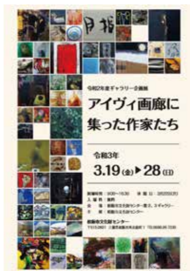
ギャラリー企画展ポスター