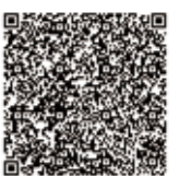
文化財センター情報は こちら

お手持ちのスマートフォン、タブレットなどで市内中学生のガイド(第1展示室)を動画で視聴できます。