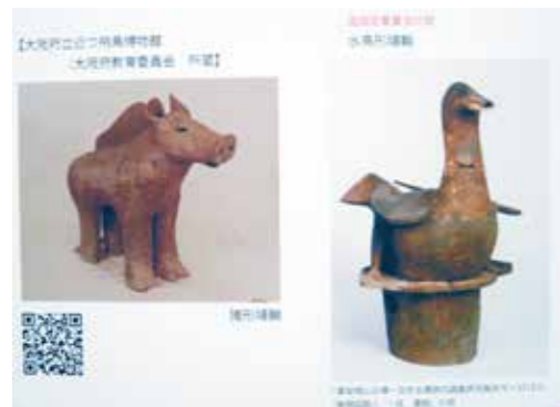
画像と二次元コード

文化財センターでは、7月23日(木・祝)から9月6日(日)まで、夏季企画展「埴輪どうぶつえん〜宝塚1号墳埴輪出土20周年をむかえて〜」を開催しています。動物の形をしたものや動物の絵が描かれたものなど、関東地方から近畿地方にかけて出土した珍しい埴輪や土器、まつりの道具などを展示しており、それぞれの動物はもちろん、出土した古墳についても分かりやすくパネルで解説していますので、まるで動物園に行った時のようなわくわくした気持ちになってもらえることと思います。