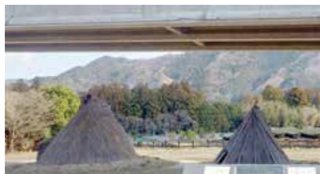
高架下の粥見井尻遺跡公園

日本では縄文時代初め頃に同じ場所に住み続ける定住生活が始まったといわれています。粥見井尻遺跡はこの頃の様子を伝える貴重な遺跡として県指定史跡に指定されています。