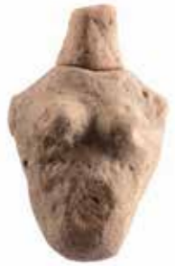
粥見井尻遺跡の土偶 (三重県埋蔵文化財センター所蔵)

見つかった2点の土偶のうち1点は、粘土で膨らみのある胴体を作り、頭や乳房を貼り付け、女性の上半身をかたどっていました。もう1点は、頭の部分だけが出土しています。2点とも縄文時代初め頃(約12,000年前)の土偶とわかりました。この時期の土偶は国内でも少なく「日本最古の土偶」と考えられており、県指定有形文化財に指定されています。