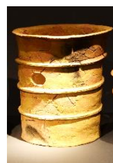
①筒の埴輪 (円筒埴輪)