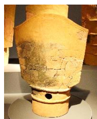
②道具の埴輪 (盾形埴輪)