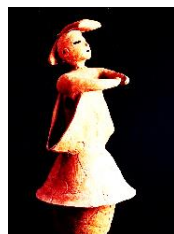
⑤人の埴輪 (巫女の埴輪)