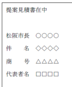
提案見積書用封筒（表）