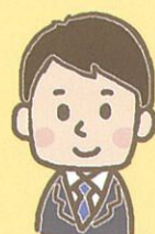
ケースワーカー、 保育士、教員など

家庭の困りごと、こど もの悩み(本人、家族 も含む)についてご相 談ください。 必要時には他機関と も連携します。