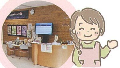
はるるコンシェルジュ