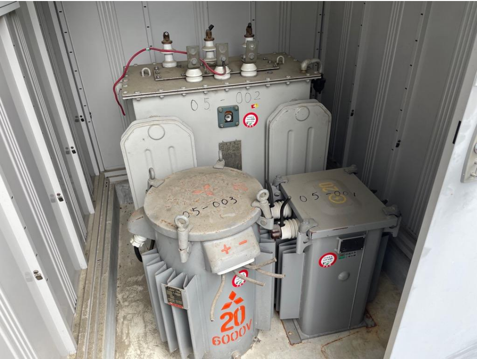
番号 05-001 変圧器 (トランス) 愛知電機 20KVA