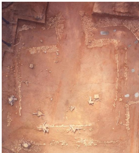
発掘調査時の 宝塚1号墳の造り出し

盾形埴輪は、造り出しの舞台を守るように外側に向けて置かれ、造り出しの東西にある冪形埴輪と冪形埴輪の組み合わせは、多くの壺形埴輪に囲まれるように置かれていました。このような埴輪の組み合わせは、当時の様子を知る貴重な資料になっています。