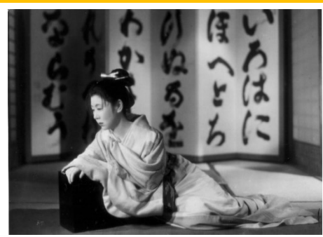
「西鶴一代女」1952年 田中絹代