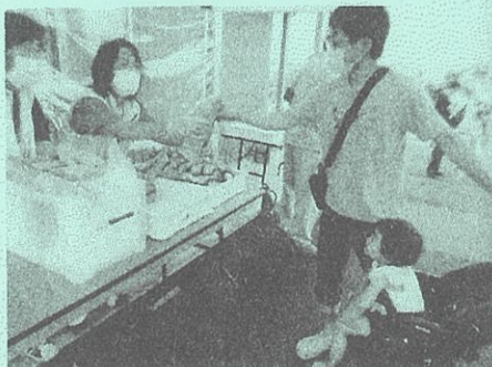
炙りもろこし・きゅうり漬けの販売