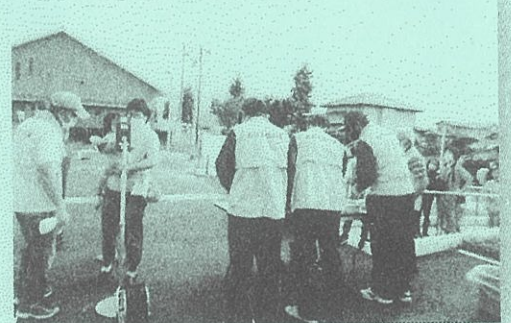
検温、消毒など受付でしっかりと