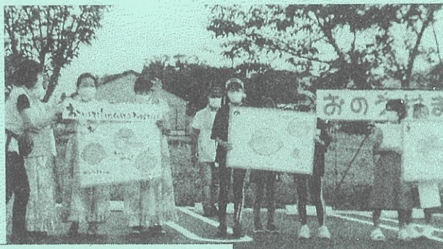
コロナ感染対策のよびかけ

今回の「おのえ村まつり」は、住民自治協議会の委員やボランティア、来場者の皆さんにとって、“コロナ災害における防災訓練のはじめの一步”となり得たのではないのでしょうか。