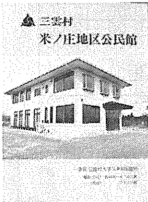
↑ 公民館完成時の リーフレット

米ノ庄公民館は、昭和60年(1985年)3月に完成しました。以後、39年間に渡って地域住民のために生涯学習等の社会教育に推進する「住民に最も身近な公共施設」として中心的な役割を果たしてきました。