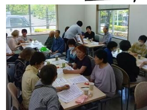
ハッピーサロンの様子

先日、ハッピーサロンを開催しました。ご希望により介護保険のお話をさせていただき、その後、飲み物を飲みながらおしゃべりタイムで午後のひと時をお過ごしいただきました。 『ハッピーサロン』受付中ですので、下記までお気軽にお声かけください。【問】松尾・大河内・宇気郷 福祉まるごと相談室 ☎ 0598-58-3960