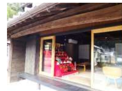
※写真は昨年の様子です