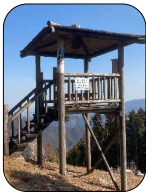
展望台でひとやすみ…

これから本番を迎える行楽シーズン、新緑の髯山でハイキングなんていかがでしょうか？