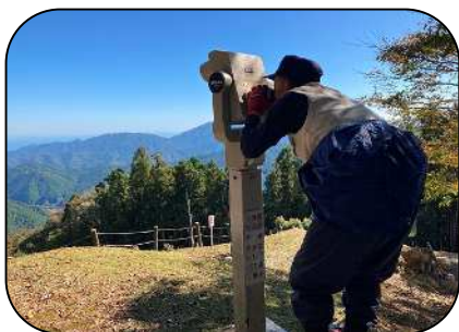
さて、山頂から何をみましょう？