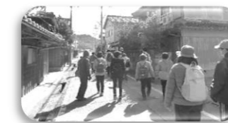
ひな祭りウオーキング

公民館活動を中心に、地域の歴史、文化の伝承、公民館クラブの活動支援など、生涯学習講座「大石学級」の開催、各自治会をはじめ、地域の皆さんの担い手としての参加を得るなど、ひな祭りウオーキング、グラウンドゴルフ、地域の山登山、地域、世代間交流事業(地域交流体育祭、クラブ発表会など)に取組みます。