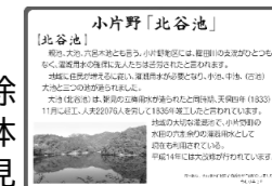
北谷池の歴史表示板

各自治会の環境保全会を中心に、除草、植樹、獣害対策など、また、通学路の除草活動にも取り組んでいきます。担い手の高齢化など、課題もありますが、各団体における連携を深め、地域における環境保全の取組を支援します。また、地域の見所表示にも取組みます。