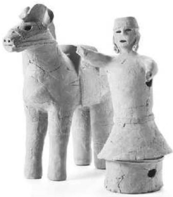
馬形埴輪・人物埴輪 (三重県指定有形文化財) 常光坊谷4号墳出土

今回の春季学習支援展示では、松阪市内の遺跡や古墳で見つかった縄文・弥生・古墳時代の貴重な資料を展示します。