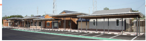
子ども発達総合支援センターそだちの丘

心身の発達に不安や心配のある子ども及びその保護者を対象とした相談や発達検査を行います。