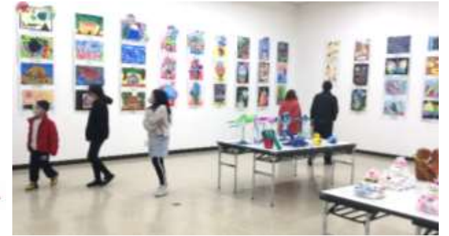
「令和5年度 松阪市幼小中造形展」にて