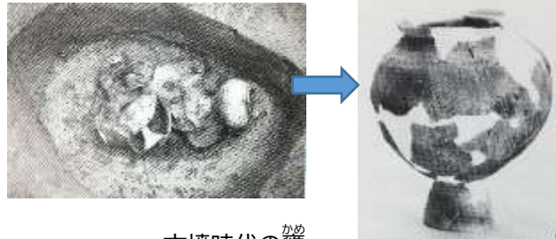
古墳時代の甕 松本権現前遺跡(小舟江町)

一つ目は、古墳時代(1,600年ほど前)の遺構(建物跡など)と遺物(道具類など)です。古墳時代前期の一辺が約5mの正方形のような竪穴建物の跡が見つかりました。その中央辺りには、炭化物を含む土が確認され、そこで火を使っていたとわかりました。