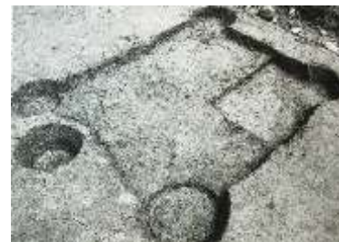
掘立柱建物 松本権現前遺跡(小舟江町)

二つ目は、中世(400年から800年ほど前)の掘立柱建物が確認されました。その建物跡の中には、約1.1m四方、深さ約30cmの土坑(大きな穴)が掘られていました。この遺跡からは、土師器皿(釉をかけずに焼いたうすい土器の皿で、一般的に使われた)や山茶碗(釉を使わず焼いたもので、主に東海地方で使われた)なども確認されました。