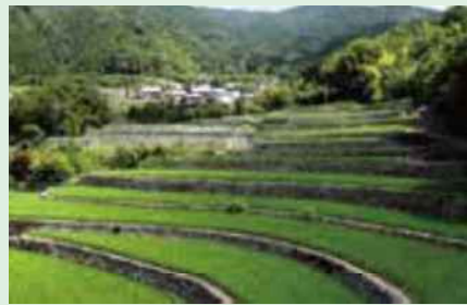
石の芸術 深野棚田の景色が目の前に広がる

幾重にも積まれた自然石の風景は「石の芸術」と称され、棚田百選にも選ばれている。全国的にも石積み棚田は珍しく、田園風景を楽しみながらの散策がおすすめ。