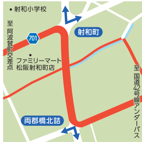
【K】射和町/両郡橋北詰 10:00~16:10