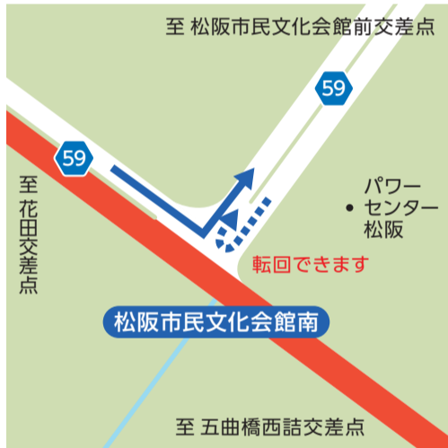
【F】松阪市民文化会館南 9:00~11:50