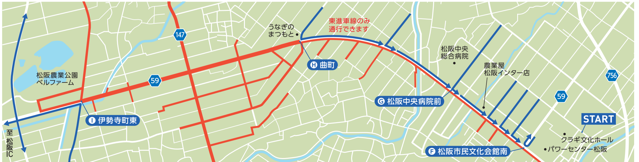
スタート会場付近~松阪IC 9:15~12:30