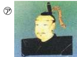
がもう うじぞう 蒲生 氏郷

前回(8月号)に引き続き、松阪ゆかりの著名な人物について紹介します。4人の偉人(左)と行ったこと(右)を★で結んでみよう。答えは、右下にあるよ!