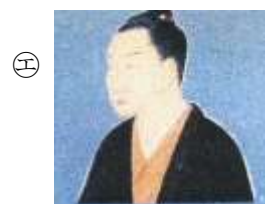
もとおり のりなが 本居 宣長

享保15(1730)年、現在の松阪市本町の木綿商の家に生まれた。医者のかたわら、『古事記』(現存する日本最古の歴史書)の研究を始め、35年をかけて『古事記伝』という解説書44巻を書き上げた。12歳の時から亡くなる72歳まで住んでいた家は、床の間に36個の鈴を掛けていたことから、『鈴屋』(国指定特別史跡)と呼ばれる。また、奥墓(国指定史跡)は、山室山に自らの墓を作ると決め、遺言通り墓の碑文は自筆で、墓地の周りには山桜が植えられている。