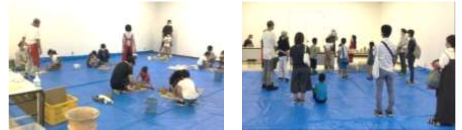
「はにわづくりの会」が主催するワークショップ『ハニワ作り体験教室』(文化財センターにて)

「はにわづくりの会」のみなさんは、埴輪について勉強会を開いたり、奈良県などに行って実際の大きな古墳を見たり、博物館でいろいろな埴輪を見たりして勉強を重ねました。そこで学んだことをもとにして、市内の幼稚園や小学校などをまわって、実際に子どもたちに、埴輪のお話をしたり埴輪づくりをいっしょにおこなったりして、宝塚古墳や埴輪に親しむことを目的に、現在にいたるまで積極的に普及活動を行っています。