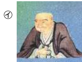
みつい たかとし 三井 高利

寛永16(1639)年、現在の松阪市射和町で生まれた。本名は三井友翰という。生まれは商家であったが、少年の頃から俳諧に関心があり、31歳の時に家の仕事を辞め、松島(宮城県)に移って俳諧の道に進んだ。一日でどれだけ多く句を詠めるかを競う「大矢数」に挑戦し、一晩に3,000句という記録を樹立し、これ以後「三十嵐」と名乗った。故郷に帰った際は、射和延命寺からの九景など、俳文を残した。