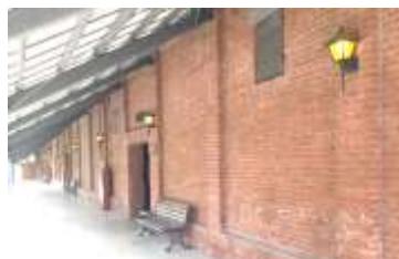
松阪市文化財センターギャラリー前

ちなみに、松阪市文化財センターでは国指定重要文化財などたくさんの文化財を収蔵・展示しています。ギャラリーがある赤レンガも国の登録有形文化財となっています。ぜひお越しください。