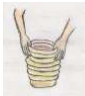
②粘土を紐状にして、それを重ねて形を作る。