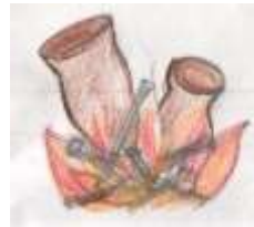
④水分を含むと割れやすいので、よく乾燥させて、野焼きにする。

①から④の工程で、縄文土器は日本の各地で作られるようになり、地域や時期によってさまざまなものがあります。