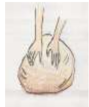
①粘土に砂や植物の繊維などを混ぜる。