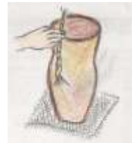
③縄を転がしたり、木の棒や貝がらを押し付けて模様をつける。