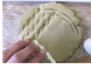
縄や貝がらを粘土に押し付けて模様を作る。

今回は縄文土器について紹介します。縄文土器は、日本の各地で作られました。土器が作られたことにより、煮炊きや盛りつけ、貯蔵ができるようになり、以前より人々は少しずつ暮らしやすくなったと考えられます。表面には、縄目の模様が付いたものが多いのですが、模様となる縄はどのように作られたのでしょうか？縄は、植物の茎やつる、木の皮の繊維などを材料とし、それを編んだものだと思います。それを確認するために、今回は縄文土器をイメージして、実際に縄や貝がらを押し付けてみました(右の写真)。すると、想像以上にしっかりと模様がつきました。本来の縄文土器は全体の形を作った後に模様をつけるので、さらに難しかったと考えられます。一般的な縄文土器の作り方は、下の絵の通りです。