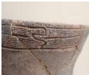
下沖遺跡(嬉野宮野町)

縄文土器という名前のように、縄の模様がしっかりついた土器もあれば、縄の模様以外の土器もたくさんあります。下沖遺跡から発掘された縄文土器は、縄の柄がしっかりと付いています。