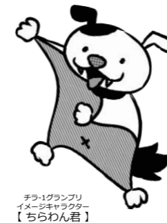
チラ-1グランプリ イメージキャラクター 【ちrawnくん】

三重県内で活動する市民活動団体の自作チラシのNo.1を決定するチラ-1(チrawn)グランプリ。公式フェイスブック上にて「いいね!」による人気投票を実施し、結果発表会にてグランプリを決定しました。