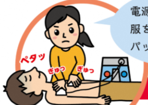
電源をいれてパッドを2枚はる

講習をうけて、技術と意思がある場合には、気道確保をして約1秒かけて胸が上がるのが分かるくらい息を吹き込みます。