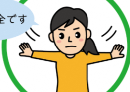
まわりの安全を確認