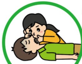
※ 気道確保して人工呼吸