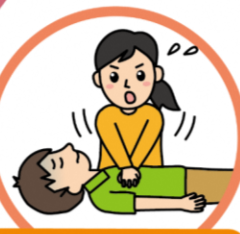
胸骨圧迫から再開