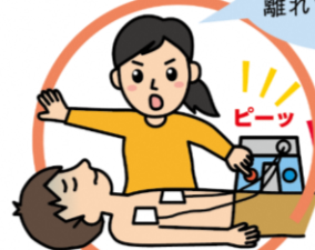
※ 心電図の解析と電気ショック