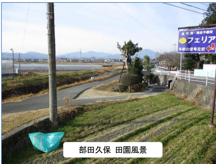
部田久保 田園風景

自治会活動も講と非農家の方たちとの温度差、又町づくりの活動が地域のより良い生活環境を形成していくことが望まれる地域です。