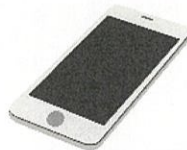
マイナンバーカード読取対応のスマートフォン