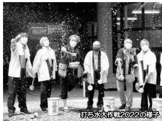
打ち水大作戦2022の様子