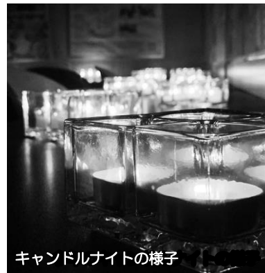
キャンドルナイトの様子

7月22日、カリヨンプラザ1階にて打ち水大作戦を実施しました。当センターでは毎年この地域で打ち水を呼びかけており今年で15年目を迎えます。今年カルチャースクールブンカの交流館のウクレレ講座の先生と生徒さんにオープニングとして演奏していただきました。打ち水は身近なエコ活動のひとつ。私たちの呼びかけにより身近な環境について考えるきっかけになることを願います。