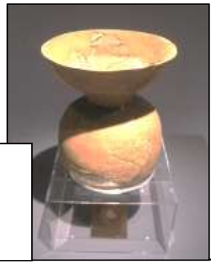
鏡越しに底の穴が見える→