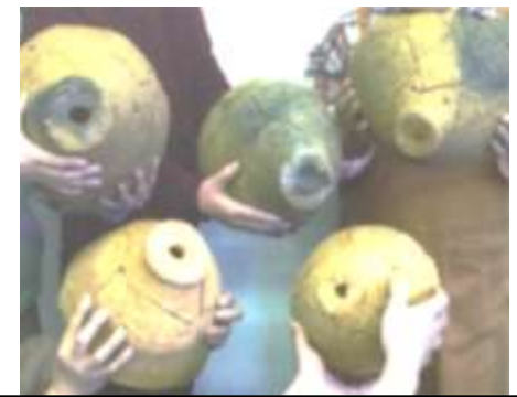
壺形埴輪 宝塚1号墳出土 ↑このように 壺形埴輪の底は穴が開いている