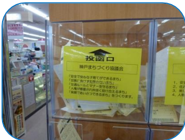
マックスバリュ学園前店