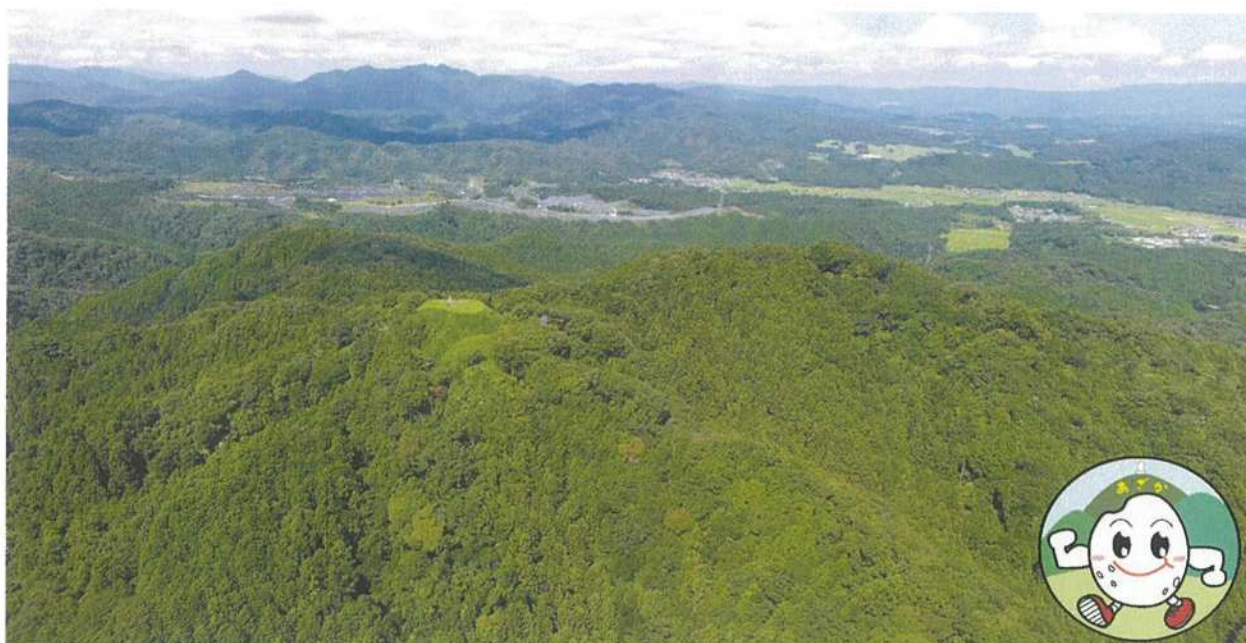
白米城キャラクター ハク 白マッスル