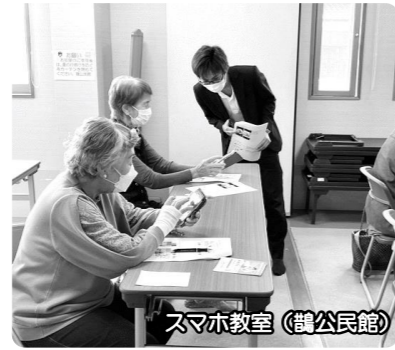
スマホ教室（鶴公民館）

「げんきアップ松阪」は、住民自治協議会（以下、住協）をサポートするために登録された市民活動団体グループの名称です。この取り組みの本当の名前は「松阪市の市民活動における地域づくり団体サポート事業」と言いますが、長くて呼びにくいのでこのグループ名をニックネームとして使っています。「こんにちは、げんきアップ松阪です」という挨拶で、あなたの地域にお伺いいたします。