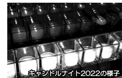
キャンドルナイト2022の様子

6月21日夏至に、 今年もキャンド ルナイトを実施。 当日の夜、ラウ ンジを消灯して 並べたキャンド ルに火を灯しま した。