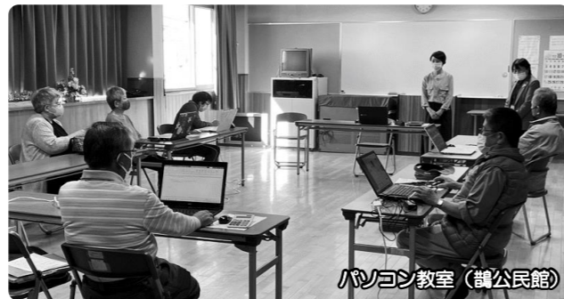
パソコン教室（鶴公民館）

地域活動やサークル活動においてパソコンの使用は不可欠なものです。地域活動の計画書や活動後の報告書の作成、事業の発表や必要な写真の整理などにはパソコンの活用が欠かせません。他にもホームページを作れば外部へのPRにも役立ちます。パソコン教室は1回のみで開催でしたが、これがきっかけとなり、その後参加者の皆さんの希望でパソコンサークルに発展しました。