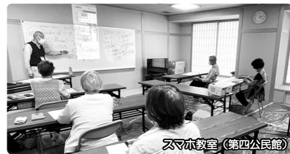
スマホ教室（第四公民館）