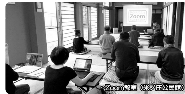
Zoom教室（栄ノ庄公民館）

Zoom（ズーム）はコロナ禍において広く活用されているオンライン会議ツールです。遠く離れた会場に行かなくても、自宅や公民館に居ながら会議やセミナーに参加できるこのツールは、とても便利ですが、いざやってみようと思うと一人では戸惑うこともありますよね。Zoom教室では、初めてのZoom体験としてインストールから会議の開始までサポートし、オンライン会議を体験していただきました。