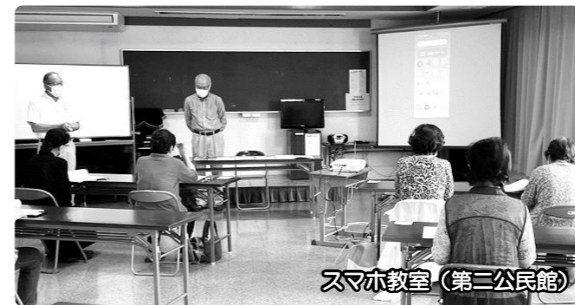
スマホ教室（第三公民館）

2022年、スマホの普及率は94%になりました。今や様々な世代が所有するスマホですが、まだまだ電話やメール「だけ」の利用に留まっている方も多いのではないのでしょうか？げんきアップ松阪ではそういった方を対象にしたスマホ教室の需要が高く、定期的に複数の地域で開催しています。特に人気なのがスマホ活用の入口として最も向いている、LINE（ライン）の使い方講座です。家族との連絡やサークルメンバーとの連絡を今よりも「スマート」にする為に、まずはスマホに慣れることから始めてもらうことが大切ですね。