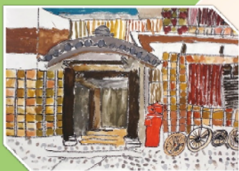
まつさかればしみんどくしりょうかん