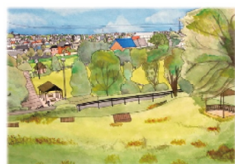
宝塚古墳公園から見た風景