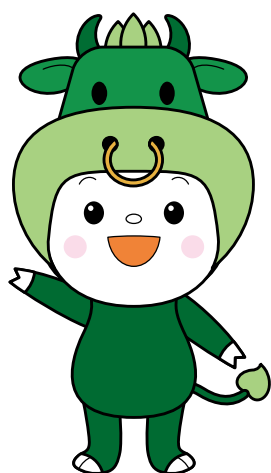
松阪市マスコットキャラクター ちやちやも