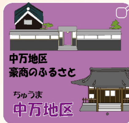
中万地区 豪商のふるさと