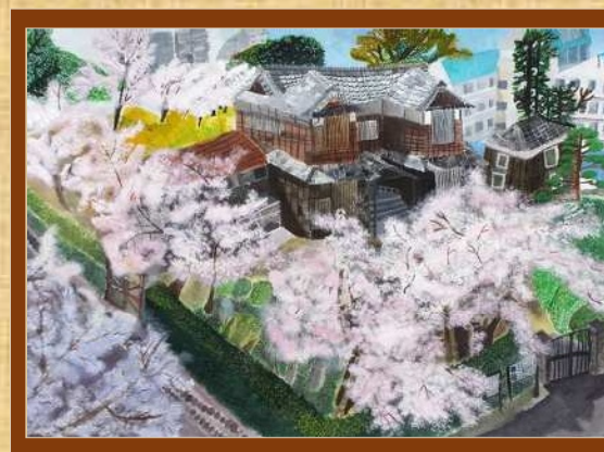
桜と歴史民俗資料館