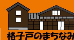
格子戸のまちなみ