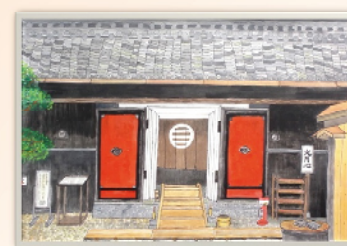
旧長谷川治郎兵衛家の大蔵