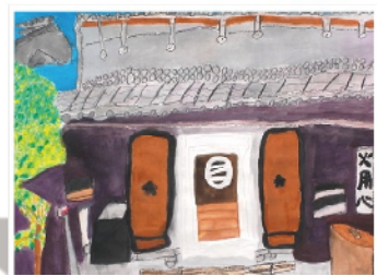
りっぱなおやしきのくろ