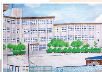
思い出の徳和小学校