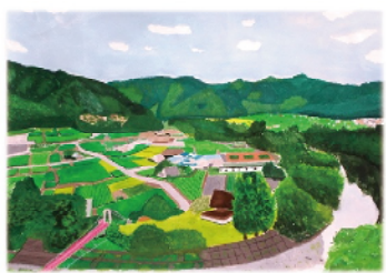
緑織りなす木々と茶畑