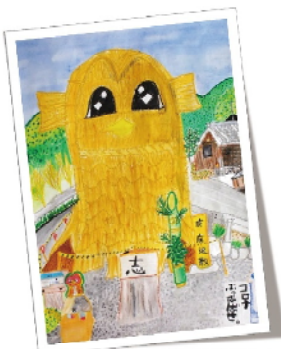
疫病退散！ コロナをぶっ飛ばせ！！