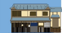
旧小津清左衛門家