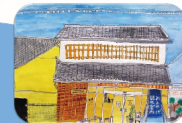
美しいおみやげやさん