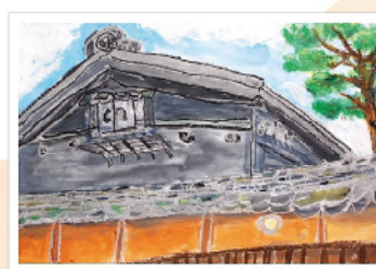
水綿を入れた黒い蔵