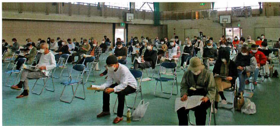
代議員 / 傍聴者

地域の皆様に喜ばれ、たくさんの方に参加していただけるよう委員一同事業を実施してまいりますので、皆さん方のご理解ご支援をお願いします。