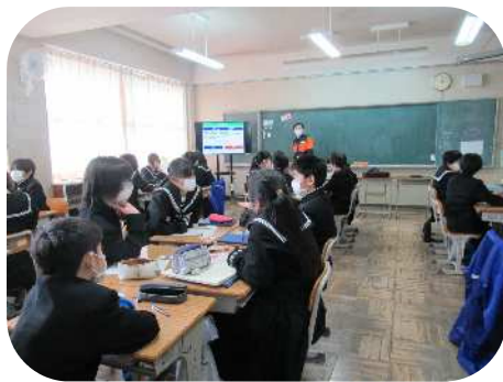
【災害時の行動についてグループで話し合い、消防団員の解説を聞く生徒たち】