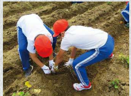
ふれあい農園 さつまいもの苗付・収穫を通じて、港幼稚園の園児や港小学校の児童と地域の皆さんが交流を行います。

を解決し、地域の特性を生かしたまちづくりに取り組み組織として、令和3年4月にスタートしました。 本協議会は、大塚町、久保田町、大平尾町、新松ヶ島町、町平尾町、船江町(船江町団地北)、狛師町で構成され、地域振興部会、安全防災部会、健康福祉部会、自治会部会、公民館部会の5部会で活動しています。それぞれの部会では世代間の交流と親睦を目的に、うなぎつかみ大会や防災意識の高揚を目的とした防災訓練、地域の福祉や健康づくりなどの事業、そして、環境美化運動や生涯学習などの公民館活動に関する事業などを実施しています。 地域の皆さんとともに「住民がお互いに支え合いながら安全・安心で住んで良かったと思えるまちづくり」活動をこれからも行っていきます。