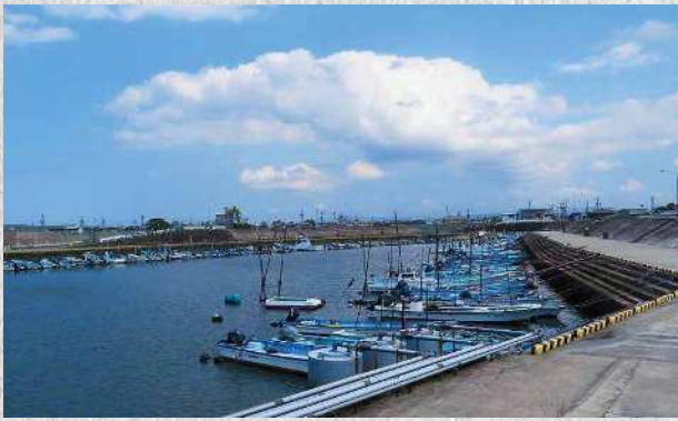
狛師漁港の風景 漁船専用の港で、伊勢湾内に出港する漁船の大漁と安全を見守ります。

港地区は松阪市の海岸部に位置し、田畑に囲まれた自然と共存する地域です。地区内には阪内川が流れ、伊勢湾では古くから漁業が盛んです。主要海産物はアサリ、あおさ、黒のりです。近年はアサリの収穫量が大幅に減少していることを受け、県内有数のアサリ生産地の復活を目指し取り組みが行われています。この取り組みは大きく評価され、昨年度、松阪漁業協同組合採貝部会が水産庁長官賞と全国水産試験場長会会長賞をダブル受賞しました。 港住民自治協議会は、平成24年3月に設立した港まちづくり協議会が、これまで以上に地域一体となって身近な課題