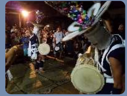
江戸時代初期頃に始まったといわれる郷土芸能。 (県指定無形民俗文化財)