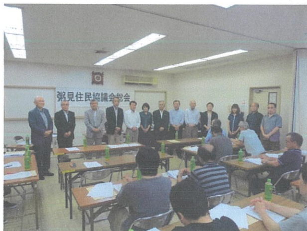
令和元年度役員のみなさん