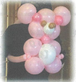
次回 くまちゃんリュック

※お問い合わせ申し込みの方は事務局までご連絡ください。 090-4264-2252 (事務局)