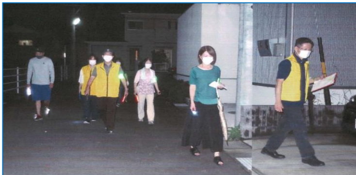
田原町自治会パトロール