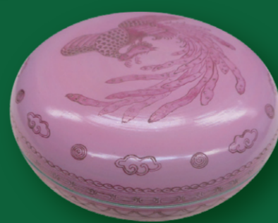
有節萬古 「腥臙脂釉蓋菓子器」 朝日町歴史博物館 所蔵