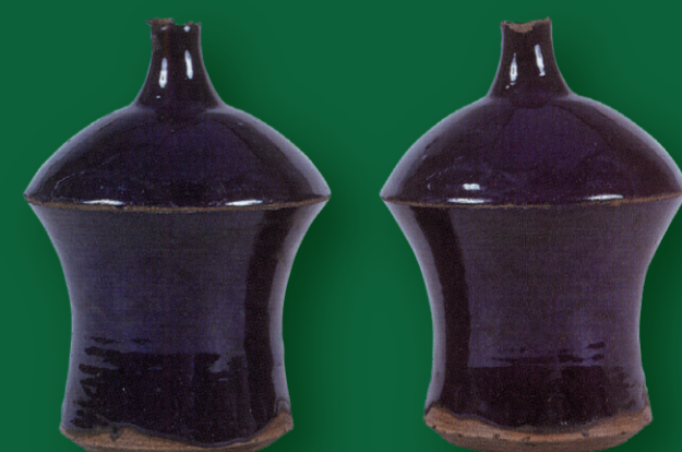
古萬古「瑠璃釉御神酒器」小向神社所蔵 (三重県指定有形文化財) 朝日町歴史博物館 寄託