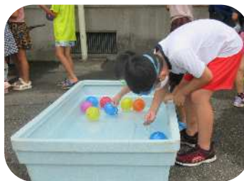
ヨーヨー釣りのようす