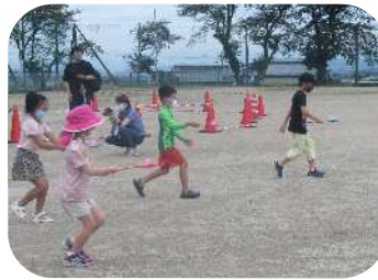
水風船を落とさないように運ぶリレーのようす

8月12日(木)、うれしのスポーツクラブAFLEC主催の「夏休みお楽しみ水風船イベント」が嬉野グラウンドで開催されました。36人の子どもたちが参加し、暑い夏を吹き飛ばす水風船ゲームを行いました。子どもたちはチームに分かれて、水風船をスプーンに乗せてバケツまで運び、その数を競うリレーゲームや水風船合戦など4つのゲームを元気いっぱい楽しみました。