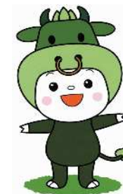
松阪市マスコットキャラクター