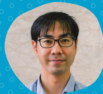
株式会社ライフステージ