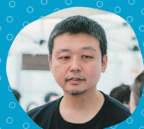
松阪市地域おこし協力隊 / 株式会社高杉アトリエ