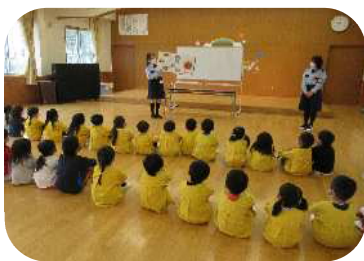
交通安全教室の様子