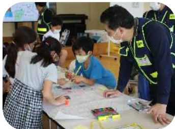
タウンウォッチングの様子

児童たちは地域の方々と一緒に嬉野上野町内を散策し、学校に戻ってから「地域安全マップ」を作成しました。作成したマップをクラスで発表し、地域安全力を高めました。