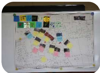
作成した地域安全マップ