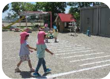
左右を確認して横断歩道を渡ります